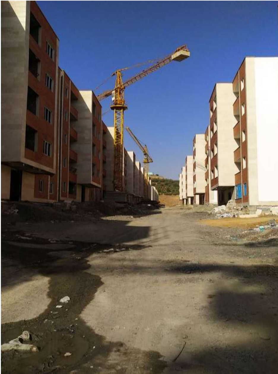
مبلغ اولیه: ۸۲۵۰۰۰۰۰۰۰۰۰