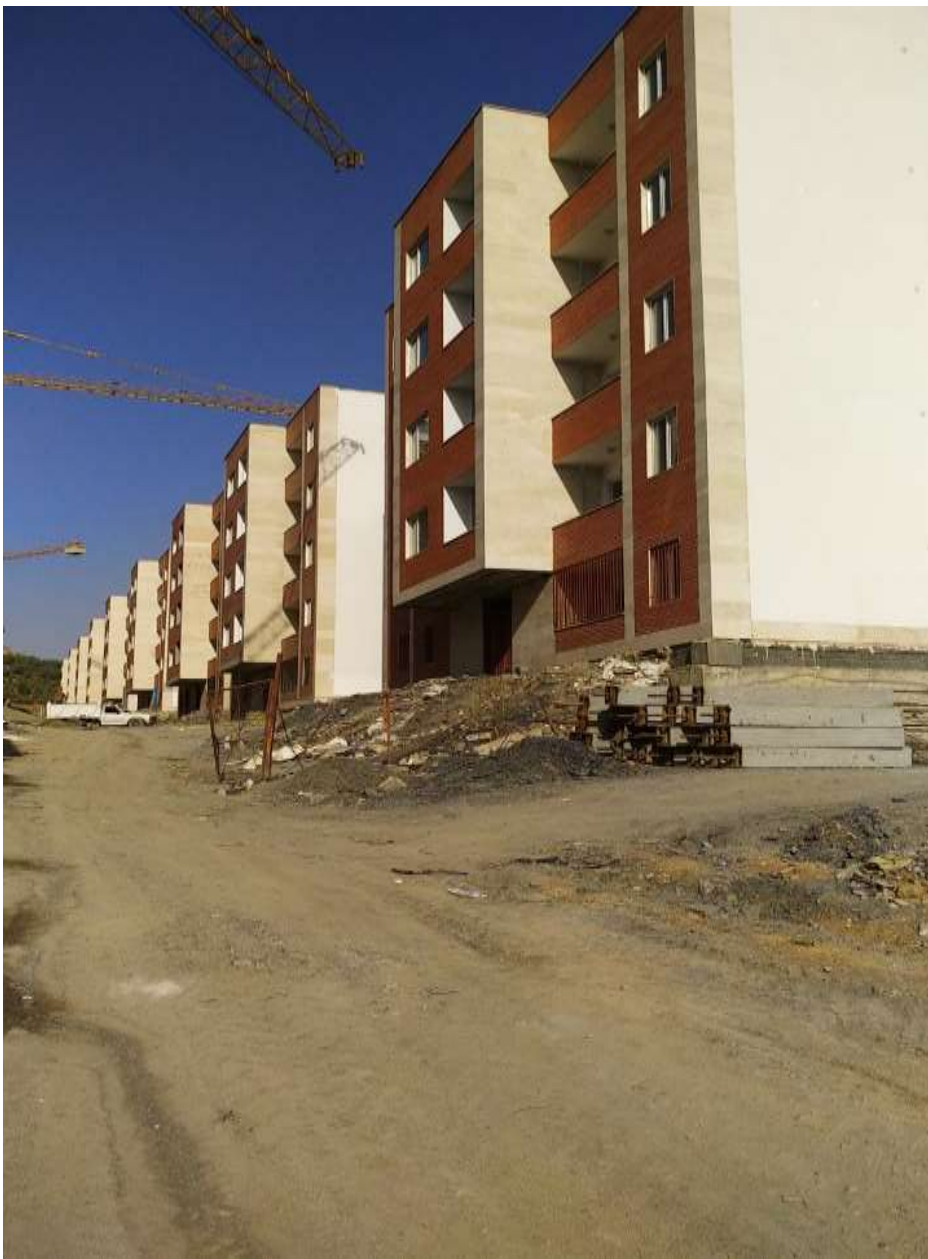
مبلغ اولیه: ۸۲۵۰۰۰۰۰۰۰۰۰