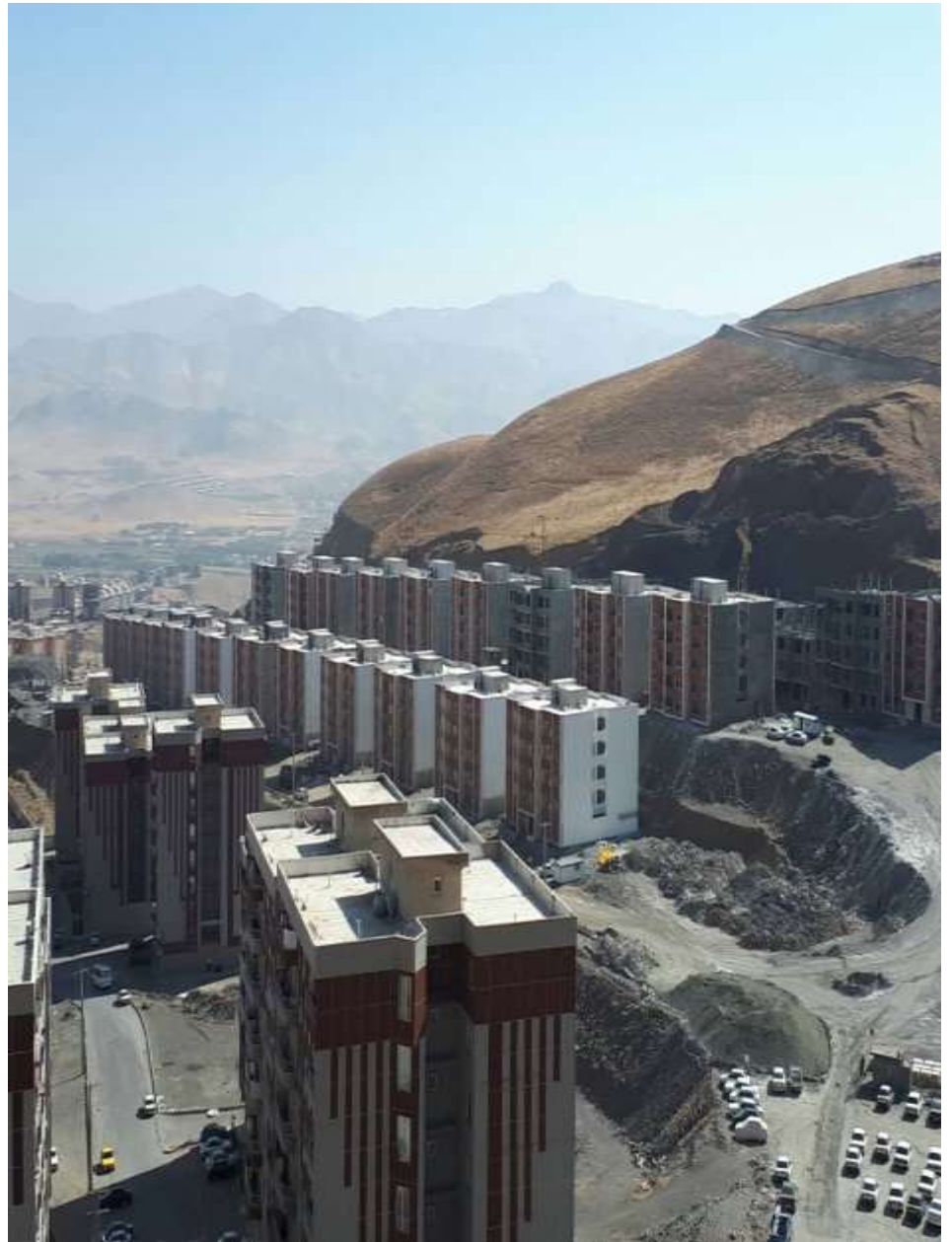
پروژه: احداث ۱۱۲۰ واحد مسکن مهر بهاران سنندج