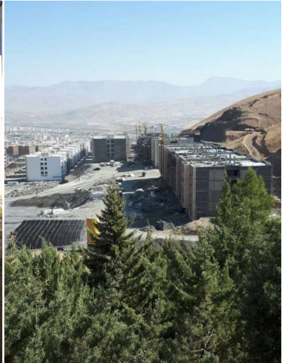
پروژه: احداث ۱۱۲۰ واحد مسکن مهر بهاران سنندج