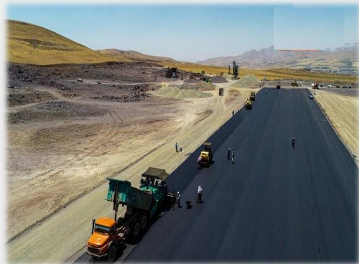
عملیات احداث باند فرودگاهی سقز