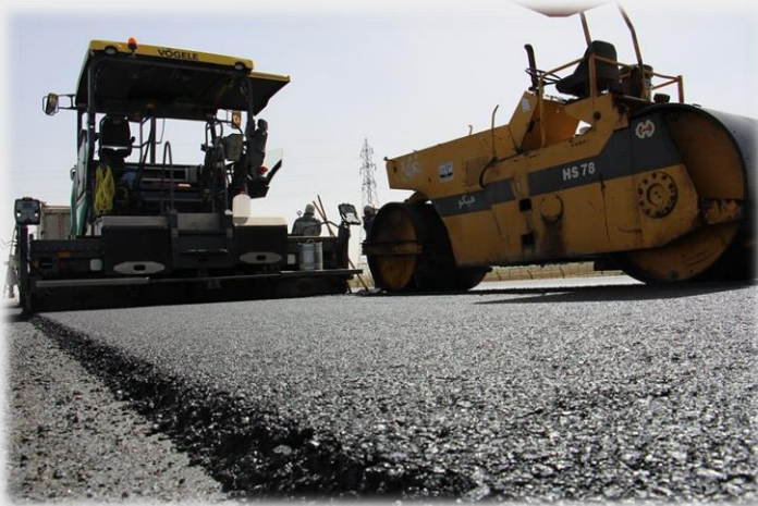
احداث کنارگذر شمالی اراک