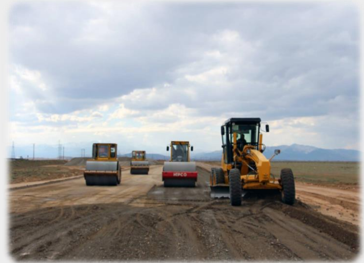
عملیات تکمیلی محور قم - اوه