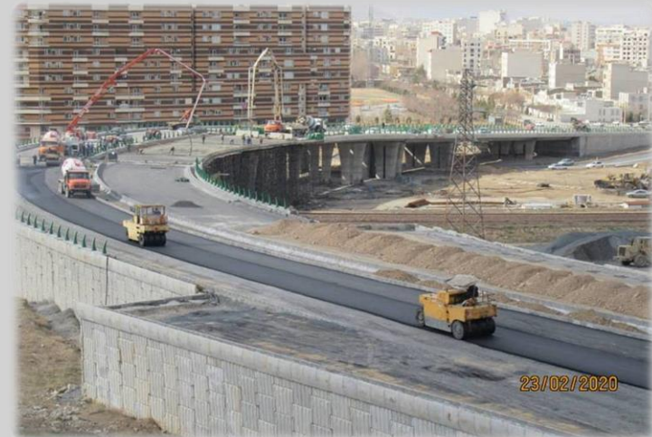
تقاطع غیر همسطح علم الهدی (اراک)