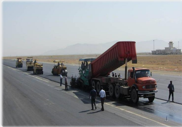
عملیات احداث باند فرودگاهی اراک