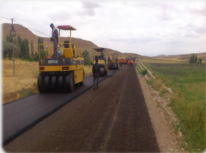
عملیات احداث دویست کیلومتر راه های روستایی کردستان