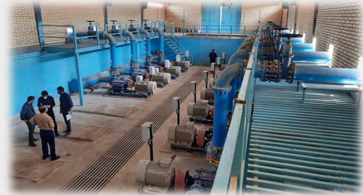
ایستگاه پمپاژ پروژه دشت لالی

Certificate holders are listed in the Concord Certification Corp. website www.concordcertification.com. Should certificate holder not place order when required, registration shall be removed. This certificate is the property of Concord Certification Corp. and shall be returned upon request.