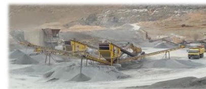
کارگاه سنگ شکن