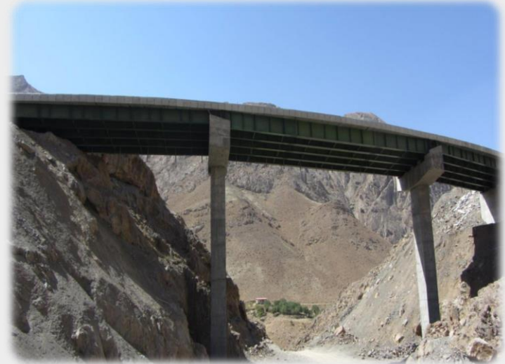
عملیات احداث محور گیان - تفرش

انجام کلیه فعالیتهای مطالعاتی ، خدمات فنی و مهندسی مشاوره ای ، طراحی ، اجرایی ، طرح و ساخت ، مدیریت پیمان ، نظارت بر طرحهای عمرانی در همه زمینه ها مشتمل بر : رشته آب ، رشته حمل و نقل ، رشته تاسیسات و تجهیزات ، رشته کشاورزی ، رشته ساختمان ، رشته صنعت و معدن