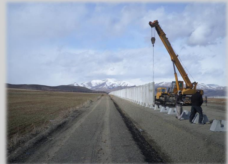
عملیات دیوارکشی و جاده دسترسی پیرامونی فرودگاه سقز