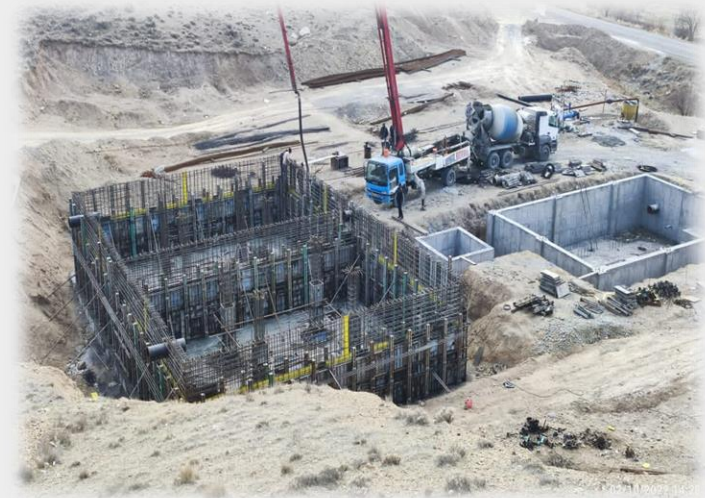
احداث ایستگاه پمپاژ نقوسان. ایستگاه پمپاژ قزلبه و مخزن هزار مترمکعبی

Certificate holders are listed in the Concord Certification Corp. website www.concordcertification.com. Should certificate holder not place order when required, registration shall be removed. This certificate is the property of Concord Certification Corp. and shall be returned upon request.