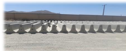
کارگاه تولید قطعات پیش ساخته